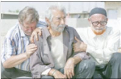
دبیر شورای صنفی نمایش خیر داد