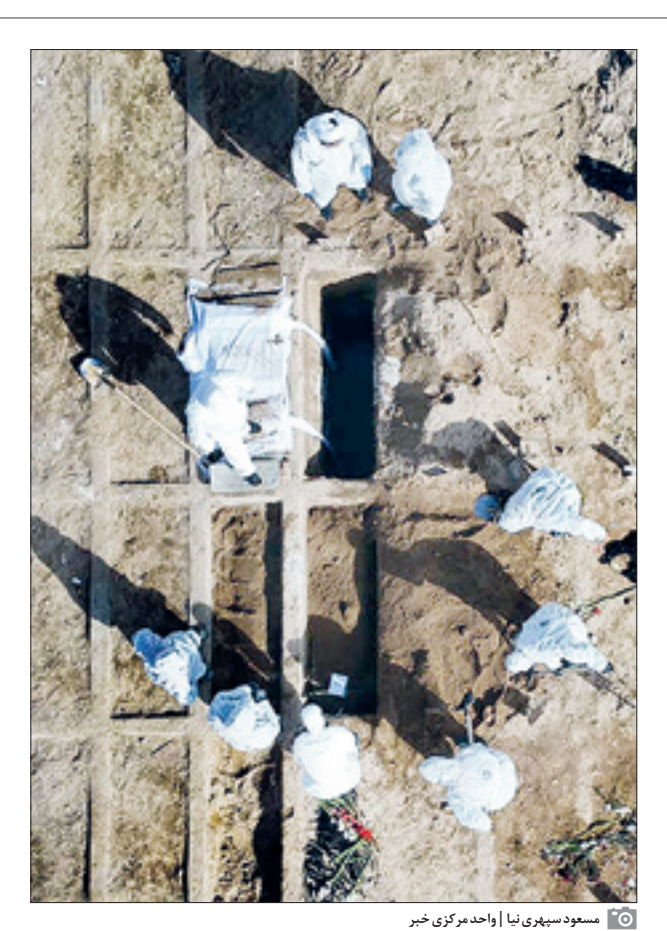
مسعود سپهری نیا | واحد مرکزی خبر

رئیس سازمان بسیج: مرحله دوم رزمایش کمک مؤمنانه از دهه امامت آغاز می‌شود