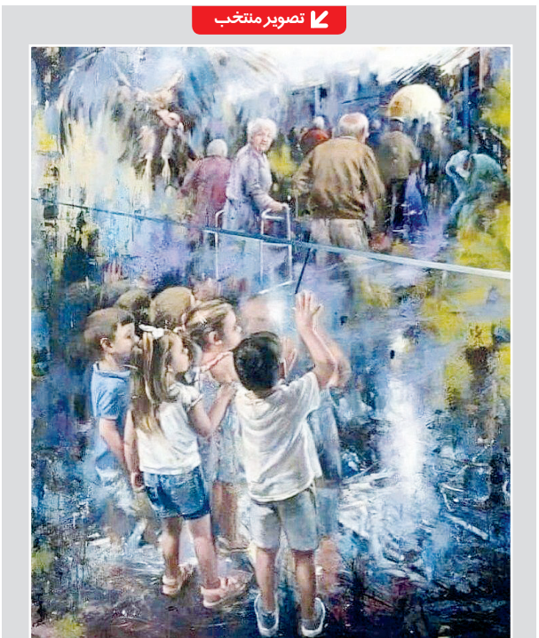
این نقاشی به یاد همه پدربزرگ‌ها و مادر بزرگ‌هایی که بر اثر کرونا بدون خدا حافظی از نوه‌هایشان از دنیا رفتند به دست نقاش اسپانیایی «خوان لوچا» کشیده شده است.

رشد سریع باشد (سخت‌افزار عالی)، دیگر مزیتی برای آن شرکت محسوب نمی شد و دنیا داشت از مسیر نرم افزار به توسعه ادامه می داد. عدم توانایی نوکیا در ساختن این واقعیت و پذیرفتن دیر هنگام آن و اصرار بر ارتقای روش‌های قدیمی به جای روی آوردن به متن‌بروز در نرم‌افزار و سرمایه‌گذاری شدید رقیب بر ضعف نوکیا باعث شد تا شرکت در سرازیری سقوط قرار بگیرد، بعضی وقت‌ها فکر می کنم شاید گزارشات مالی خوب اعتماد به نفس کاذبی به مدیران شرکت داد و آنها را از توجه به خطرات و آسیب‌های احتمالی رقیب‌ها بازداشت.