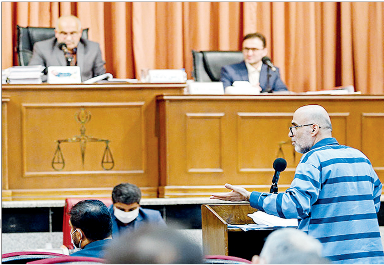
پول حلال آن قدرها نمی شود آقای رشوه خوار!

شهریار سیاهی: اقای طبری (https://twitter.com/hashtag/src-hashtag_click) رفیقم بوده دوست داشتم اموالش رو بده به اقا ما خونمون تو لوساونه یک حسی بهم میگه این روزاست که اکبر طبری بیاد در خونمون بگه خب گمشو برو بیرون! من برم سند خونه رو به چک بکنم این اکبر طبری توش نباشه! علی ضیا: رفیق اییشنون برائشون میلیاردری پول به حسابشون میریزن و کار خونه به نامشون می کنند، بعد رفیق من اسرور پیام داده دنگت شده ۵۲ هزار و ۳۰۰ تومن، از ۳۰۰ تومنش هم نگذشته.