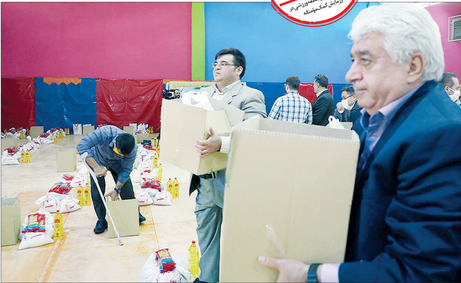
مجموعه‌ای از اعضای جوان

رزمایش همدلی و کمک‌های مؤمنانه که توسط بسیج و جامعه ورزش به خصوص به همت تربیت بدنی سپاه محمد رسول‌الله(ص) برگزار شد، کار بسیار بزرگی بود و جای خوشحالی دارد که در این مواقع با همت خیران به کمک نیازمندان می‌رویم و این مسئله وحدت جامعه را بیشتر می‌کند و نیازمندان این را می‌دانند که در مواقع سخت‌کنسانی هستند که کمک می‌کنند. نقش ورزشکاران در کار خیر خواهانه از اهمیت بالایی برخوردار است و حضور قهرمانان و ملی‌پوشان در چنین فعالیت‌هایی سبب می‌شود همان طور که این قهرمانان در زمین مسابقه دل مردم را شاد می‌کنند، در فعالیت‌های اجتماعی هم هر جا نیاز باشد حضور دارند و این کار سبب الگوسازی در بین نسل جوان می‌شود و زمینه‌ای را فراهم می‌کند که ورزشکاران جوان نیز با الگو گرفتن از قهرمانان در امور خیریه و کمک به فقرا فعال باشند.