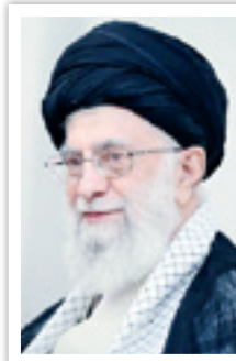
حضرت آیت‌الله خامنه‌ای، رهبر معظم انقلاب اسلامی در ارتباط تصویری با ستاد ملی مبارزه با کرونا که با حضور اعضای این ستاد و استانداران ۳۱ استان کشور برگزار شد، عملکرد ملت و مسئولان را در این زمینه در ابعاد مختلف اجتماعی- فرهنگی، درمانی، بهداشتی، علمی، مدیریتی و خدماتی «حرکتی جهادی، عظیم و افتخارآمیز» خواندند. مقام معظم رهبری با تأکید بر ثبت، بازخوانی و روایت هنرمندانه تلاش و فداکاری ملی گفتند: مردم عزیز ایران با رفتار متین و صبورانه خود انصافاً خوش درخشیدند و فرهنگ