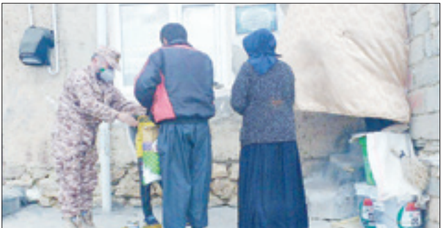
توزیع سبدهای غذایی در ایلام

در ایلام جانشین سپه‌امیرالمؤمنین (ع) اعلام کرده است در مرحله دوم رزمایش کمک مؤمنانه و همدلی ۱۰ هزار بسته غذایی در بین افرادی که کسب و کارشان در روزهای اخیر به‌واسطه بیماری کرونا دچار آسیب شده یا مشغول خود را از دست داده‌اند، توزیع می‌شود.