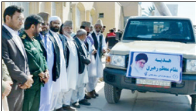
تیم پزشکی سپاه سلامت در حال توزیع سبدهای غذایی در ایلام

همچنین پیام قدردانی و سپاس حجت‌الاسلام والمسلمین عبدالله حاجی صادقی، نماینده محترم ولی فقیه در سپاه و سردار غلامرضا سلیمانی، رئیس سازمان بسیج مستضعفین، از ایثارگری و تلاش‌های مخلصانه روحانیون و طلاب بسیجی و حضور فداکارانه آنان در عرصه‌های خدمت‌رسانی به بیماران و مقابله با ویروس کرونا قوت قلب خوبی برای جهادگران بود.