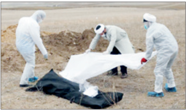
بهداشت و تعویض لباس در محل دفن متوفیان کرونایی

به دعا و توسل بود. همچنین اهدای خون توسط طلاب و روحانیون به بیماران و توزیع بسته‌های بهداشتی و غذایی، تشکیل تیم‌های مشاوره برای خانواده بیماران مبتلا به ویروس و ایجاد روحیه در آنها و تقدیر علما و روحانیون از بیماران بستری شده و خانواده آنان و بدرقه درمان‌یافتگان بخشی از کار آنها را تشکیل می‌داد.