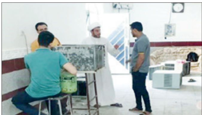
تیم پزشکی سپاه سلامت در حال توزیع سبدهای غذایی در ایلام