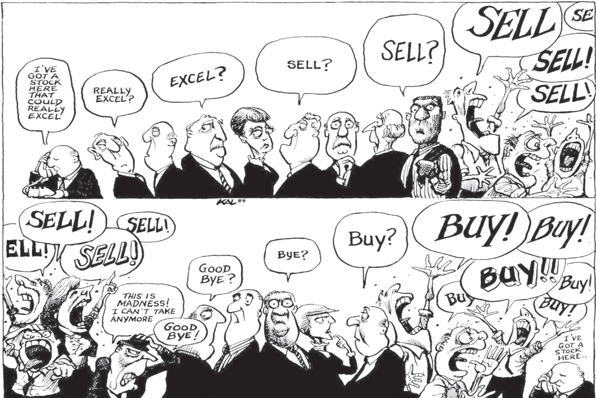
کاربران شبکه‌های اجتماعی این طرح را مصداقی از رفتار ناآگاهانه بورس‌بازان ایرانی می‌خوانند

واکنش فعالان رسانه‌ای به استقبال از #بورس_پر_خطر