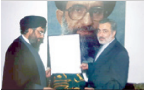
پیام نصرالله به مناسبت