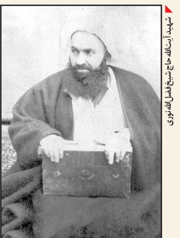
شهید آیت‌الله شیخ فضل‌الله نوری

مؤسسه مطالعات تاریخ معاصر ایران به‌عنوان ناشر این پژوهش نیز بر آن مقدمه‌ای دارد که شمه‌ای از آن به شرح ذیل است: «کتاب پیش‌رو با عنوان «اندیشه سبز، زندگی سرخ (زمان و زندگی شیخ فضل‌الله نوری)» به چاپ رسیده‌است و از حیث موضوع، می‌توان آن را به دو بخش تقسیم نمود، بخش اول در ابتدا مروری دارد بر پیشینه