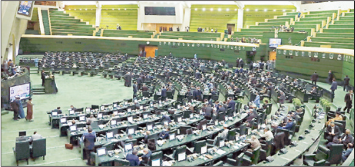
مصیر ساربانیکهبا جوان

روزنامه جوان | شماره ۱۶۱۵۰ | پنج‌شنبه ۳۰ بهمن ۱۳۹۹ | ۶ رجب ۱۴۴۲ |