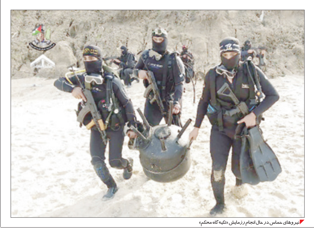
نیروهای حماس در حال انجام رزمایش «نگه‌گاه محکم»