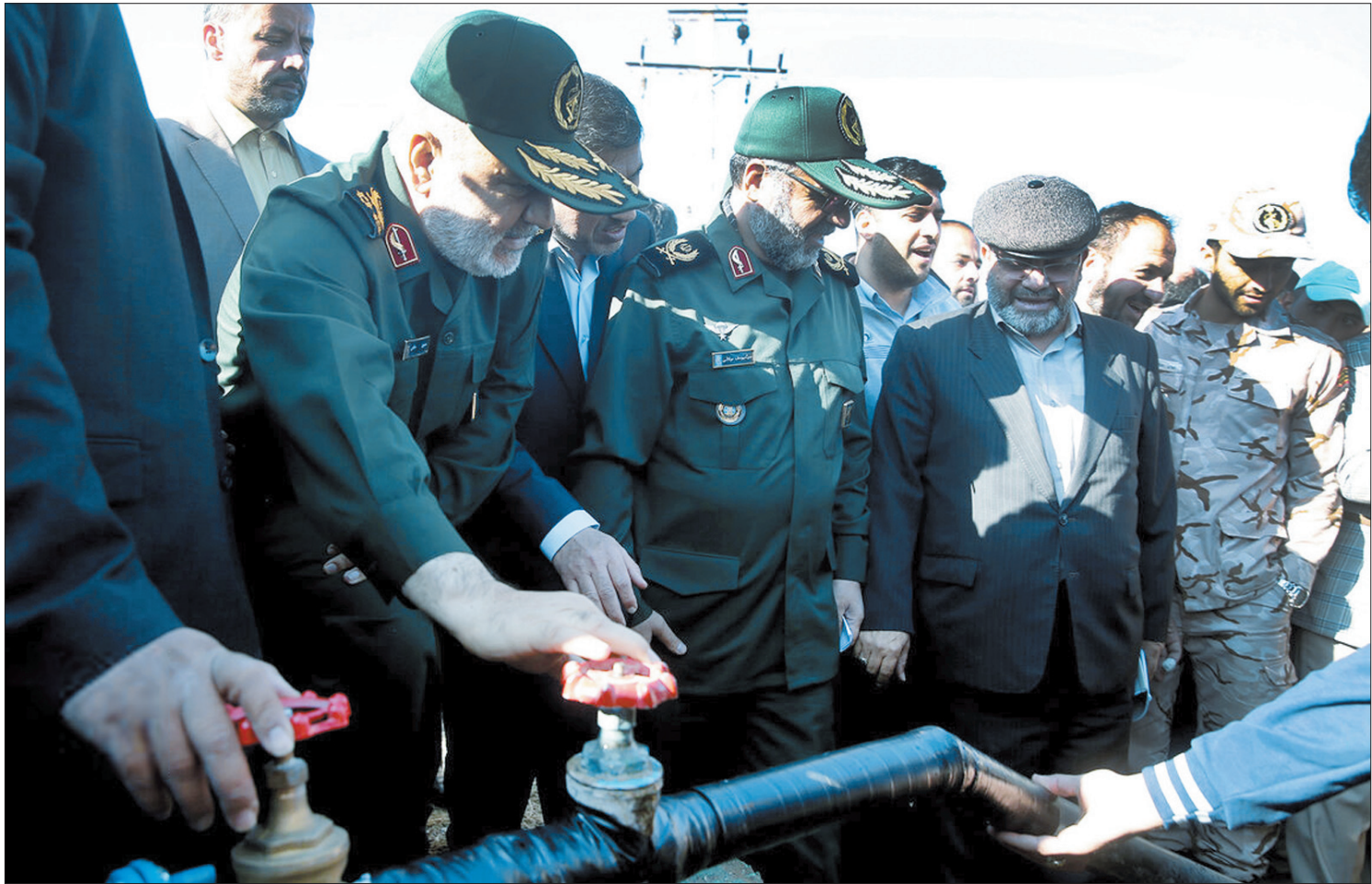
عبدالله محمدی / خبرگزاری ایرنا

سپاه دشمن فقر و محرومیت است و شأن ملت ایران رفاه است و باید همه در این راه تلاش کنیم