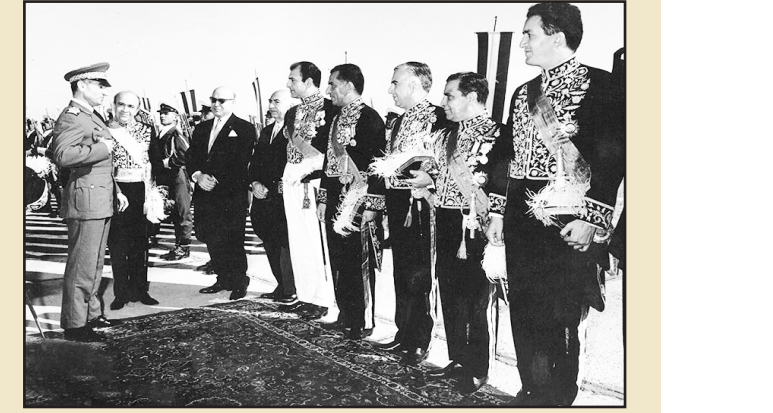
محمدرضا پهلوی در حاشیه عزیمت به یکی از سفرهای خارجی در فرودگاه مهر آباد تهران

متنشا داخلی و برخی متنشا خارجی دارند، پاسخ به این سؤال که چگونه می‌توان نظریه ساخت قدرت سیاسی عصر پهلوی دوم را با وجود متغیرهای متنوع دخیل، تبیین کرد، جامعه‌شناسی سیاسی ایران را با اهمیت می‌نماید. نظریه‌های مرتبط به ساخت قدرت سیاسی ایران، چگونه مسائل پیچیده و مهم جامعه ایران و کارکرد عناصر سیاسی، اجتماعی در عرصه قدرت سیاسی را ریشه‌یابی می‌نماید. پرسش اساسی اینست: در نظر به‌سازی ساخت قدرت سیاسی، هر گونه بحث از حکومت و پیامدها، نتایج و مؤلفه‌های آن در گرو توجه عالمانه به موقیعت اقشار و طبقات اجتماعی آشنایی با منزلت و پایگاه‌های اجتماعی آنهاست. گروه‌ها، نهادها و جریان‌های سیاسی است، چراکه محوریت نظام سیاسی و قدرت در آن تعامل با جامعه و گروه‌های مرجع نشئت می‌گیرد. عمده‌ترین مباحث این کتاب نیز با تأکید بر نظام سیاسی عصر پهلوی دوم و زمینه‌های اجتماعی و بین‌المللی شکل‌گیری آن در جهت تبیین کارآمدترین و مناسب‌ترین نظریه ساخت قدرت سیاسی و انطباق آن با پایان ضمن تشکر از مؤلف محترم، از زحمات معاون محترم پژوهشی جناب آقای غلامرضا سوسا، مدیر محترم بخش تحقیق جناب آقای اکبر اشرفی، مدیر محترم گروه اقتصاد و جامعه‌شناسی سیاسی جناب آقای سعید عبدالامیر نبوی و همکاران بر تلاش معاونت محترم انتشارات تشکر و قدردانی می‌نمایم.» پژوهشی که در فوق وصف آن رفت، توسط دکتر محمد رحیم عبودی سامان یافته است. وی در این اثر با تأکید بر اینکه حاکمیت پهلوی‌ها بدون دخالت مردم و با سلطه‌جویی و مددگیری از بیگانگان نشو و نما یافته، ساختارشناسی سیاسی این پدیده را نیز با