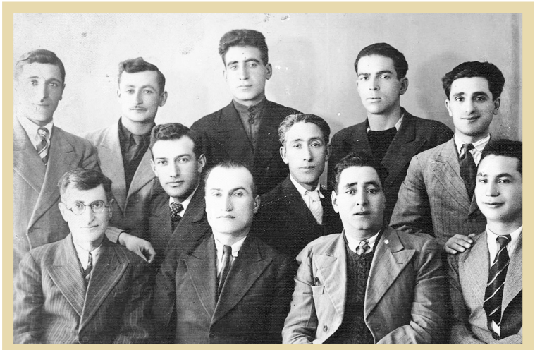
رضا روستا از رهبران حزب توده در کنار کمیته مرکزی و دستیارانش