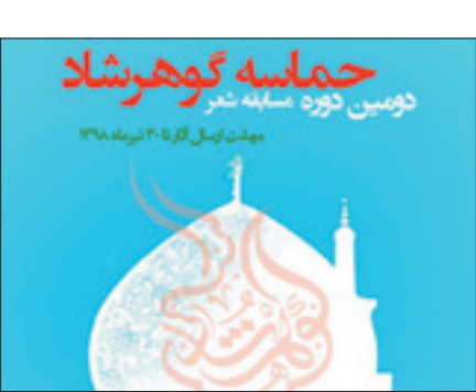
حماسه گوهر شاد

و سرود و بخش دوم شامل نوسرده‌ها(سپید و نیمایی)، گردآوری شده واز تنوع قالب مطلوبی برخوردار است. این کتاب در ۱۹۶ صفحه در ۵۰۰ نسخه توسط انتشارات شاعران پارسی‌زبان منتشر و در نمایشگاه کتاب سال جاری رونمایی شد.