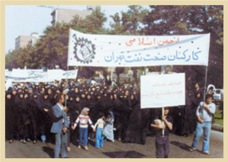
۱۳۵۷،طی از همپیمانی کارکنان صنعت نفت

رونق اقتصادی در دهه ۴۰ این امکان را برای بازاری‌ها فراهم آورد که بر حمایت خود از بنیادهای مذهبی در شهرهای بزرگ بیفزایند و در اواسط دهه ۵۰ این مؤسسات دینی به قدری قدرت داشتند که می‌توانستند دورافتاده و در شهرها به محله‌های فقیرنشین اعزام کنند تا در ارتقای سطح بینش و آگاهی مردم بکوشند. بنابرین بازار از ۱۵ خرداد ۱۳۴۲، همگام با شروع نهضت امام نقش بی‌بدیلی در حمایت‌های مالی از حرکت‌های آزادی‌خواهانه، اعتصاب و بستن بازار و تقویت نهادهای مذهبی مبارز داشت. رژیم پهلوی توانسته بود با استفاده از ابزارهای سرکوبی چون ساواک بر همه جامسلط شود اما قادر نبود بازار و مساجد را به صورت کامل کنترل کند، به همین دلیل هم بازار، کانون اصلی انقلاب شد. کمک مالی بازاریان در طول سال‌های مبارزه و گسترش نهضت امام در سراسر کشور ادامه داشت و آنان در قالب ارسال خمس اموال خود برای امام و با کمک به مبارزان