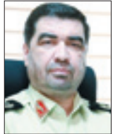
رئیس پلیس آگاهی پایتخت

پای دستگیرشدگی خودروبرداز می‌گذرد،اما همچنان شاهد تشکیل پرونده‌های متعدد کلاهبرداری به این شیوه هستیم.