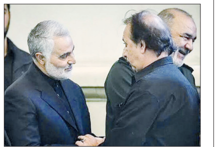
مجید مجیدی کارگردان صاحب‌نام سینمای کشورمان با انتشار پیامی شهادت شجاعانه سردار حاج قاسم سلیمانی را تسلیت گفت. به گزارش مهر، در متن پیام تسلیت مجیدی آمده است:

«الله و انالیه راجعون شهادت شجاعانه سردار سرفراز اسلام حاج قاسم سلیمانی و رجعت روح والايشان به درگاه ابدیت را تبریک و تسلیت عرض می‌نمایم. به راستی در این واقعه‌ی زینبیه‌ترین لباسی که بر تن ایشان می‌توانست مزین شود و قامت بگیرد، لباس زیبای شهادت بود. یادش گرامی و نامش بلند باد که در سرتاسر عمر پربرکت‌شان همواره ضربان قلبش برای ایجاد امنیت در کشور پهنای ایران اسلامی تپید و مانند سربازی بی‌ادعا در راهی از هدف متعالی‌اش پا پس نکشید. بدون شک خون مطهر ایشان پامال نمی‌شود و از برکت این عروج، فانوس پر فروغی روشن می‌شود که تاثیر چشمگیری خواهد داشت بر قدرت یافتن و شکوفایی ایران اسلامی.»