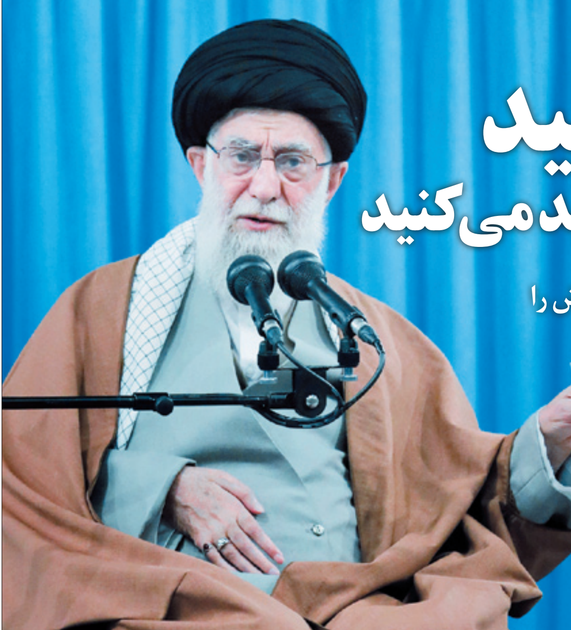
تصاویر: KHAMENEI.R | صفحات ۱۵

با حضور سردار سلامی فرمانده کل سپاه، ۲ هزار و ۴۰۰ پرونده محرومیت‌زدایی، مردم‌پاری و اقتصاد مقاومتی صبح دیروز در استان خوزستان افتتاح شد. این پروژه‌ها شامل ساخت و تجهیز خانه‌های روستایی، ساخت مسجد، خانه بهداشت، اماکن فرهنگی و ورزشی است. همچنین هم‌زمان با خجسته میلاد حضرت زینب(س) در جریان سفر فرمانده کل سپاه به استان خوزستان، طی آیینی در مصلای شهر ماهشهر ۱۱۰ سری چپ‌پزیه به زوج‌های کم‌برخوردار اهدا و بیش از ۲ هزار بسته معیشتی در مناطق محروم ماهشهر توزیع شد. سردار سلامی گفت: در سپاه پاسداران اراده کرده‌ایم که برای حل مشکلات در کنار مردم عزیز ماهشهر بمانیم و برای ساختن خانه‌های مناسب برای عزیزی که مسکن نامناسب دارند در گام نخست ۱۰۰ دستگاه خانه در این منطقه می‌سازیم | صفحه ۵