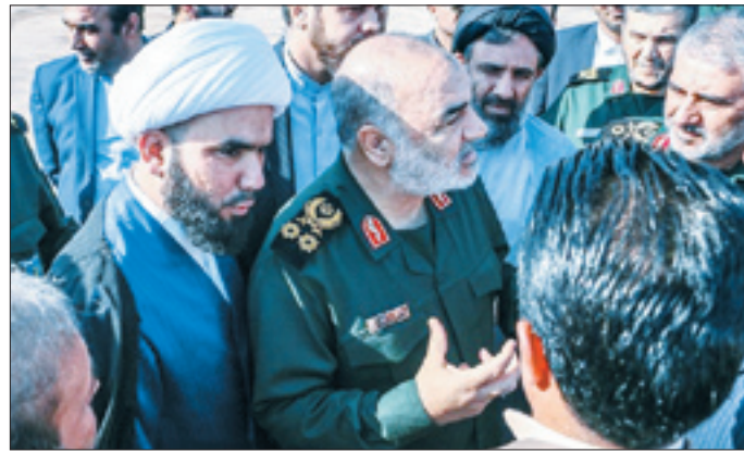
فرمانده کل سپاه در ماهشهر: ما اینجا مأمور و فرستاده رهبری هستیم

وزیر بهداشت در نامه به دبیر کل سازمان جهانی بهداشت: امریکا ارسال دارو و انجام معاملات بشردوستانه را هم تحریم کرده است