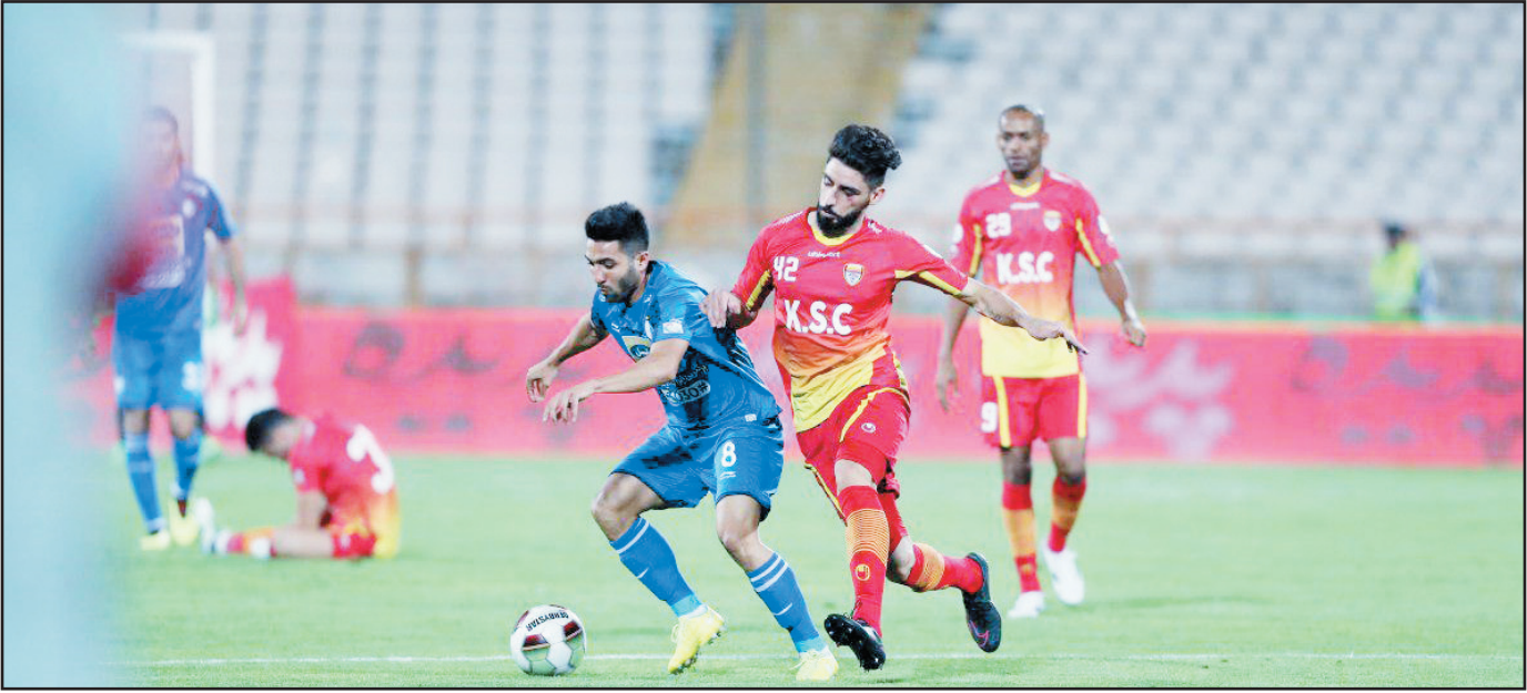
مسابقه فوتبال در ایران