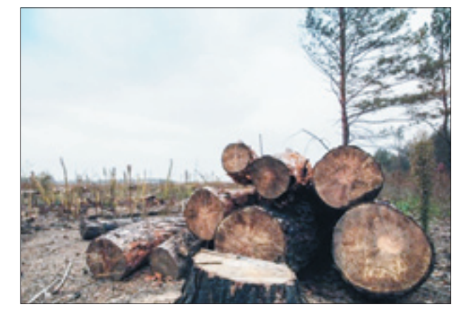
تیر سوزجویان بر تن درختان ارسباران

و رسانه ملی در استان باید برای شفاف‌سازی و استاندارد آذربایجان شرقی برای اقدامات لازم وارد عمل شوند.» حجت‌الاسلاموالمسلمین سید محمدعلی آل‌هاشم با اشاره به اینکه برخی مدعی هستند که این درختان قطع شده به شمال کشور برای فروش به قاچاقچیان منتقل می‌شوند، ادامه می‌دهد: «همه مسئولان موظف به حفظ و حراست از این منابع خدادادی هستند و باید هر چه سریع‌تر