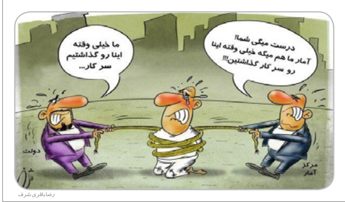
رضا باقری شرف