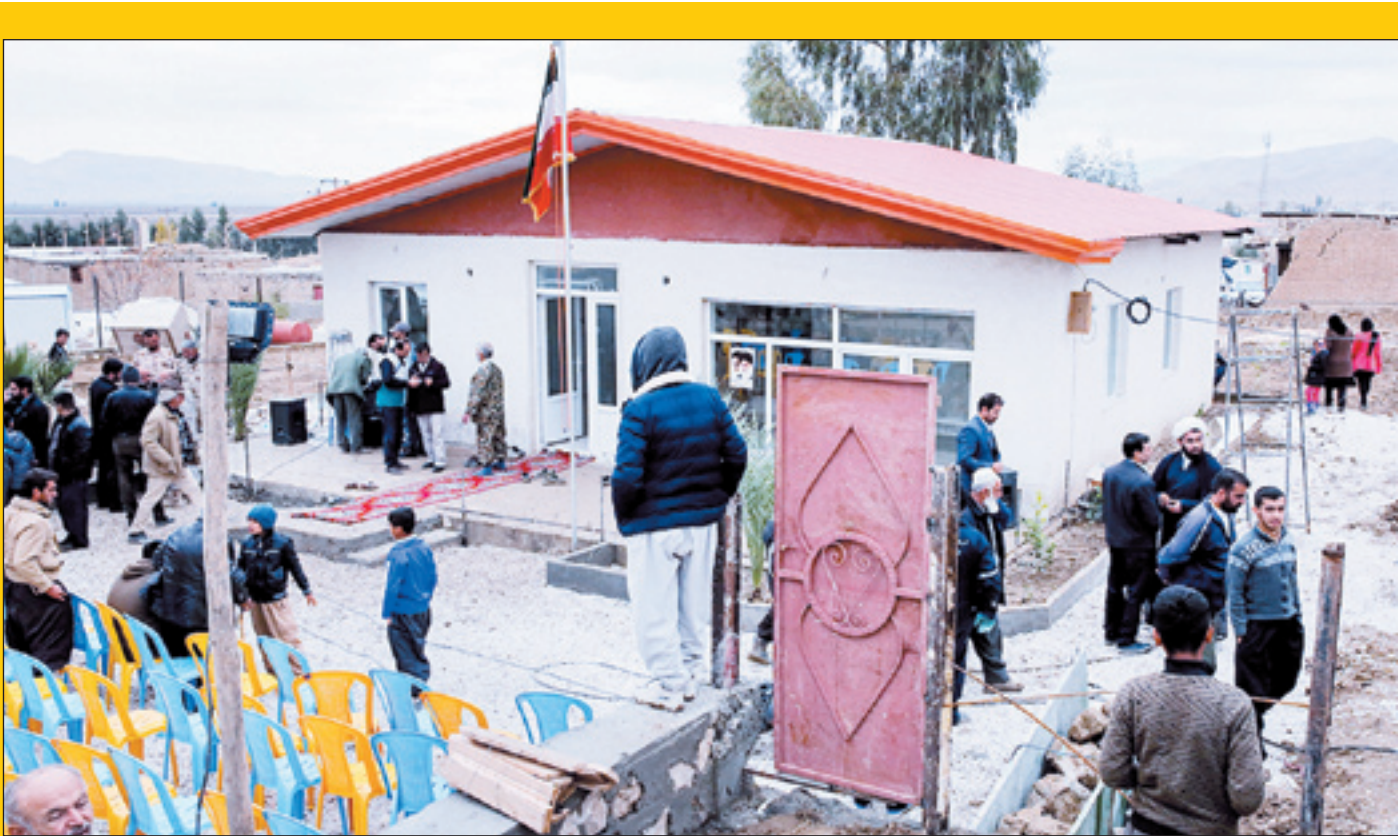
سپاه حضرت محمدرسول الله (ص) تهران بزرگ پیش از این منازل مسکونی نوسازی را در روستای کوتیک عزیز سرپل ذهاب تحویل زلزله زدگان داده است