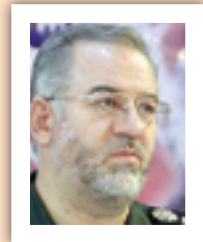
سرهنگ حسین منمن، سرپرست سازمان بسیج دانش‌آموزی و فرهنگیان کشور

سایتگرد باشد. فرهنگیان با تمهیداتی که پیش‌بینی کرده بودند حضور یافتند ولی خیلی سرد بود. خاطره بسیار جالبی که آن روز اتفاق افتاد و حال و هوای خاصی را که به خصوص در همه فرهنگیان حاضر در میدان ایجاد کرد، هم‌زمان شدن ورود حضرت آقا به میدان و قطع شدن برف و تابش آفتاب از لابه‌لای ابرها بود. بسیاری از فرهنگیان که با اشعار و ادبیات آشنایی دارند بدون اراده فریاد