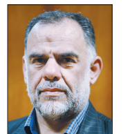
عباس حاجی‌نجاری کارشناس سیاسی

ماجرای حکم شهردار جدید تهران اگرچه بار دیگر ناکارآمدی اصلاح‌طلبان در اداره کلان‌شهر تهران را نشان داد و اداره شهر را وارد دور جدیدی از چالش و بلا تکلیفی درون ساختاری کرد، اما این انتخاب و فرآیند آن بیابگر آن است که مردم تهران همچنان باید تاوان یک انتخاب نادرست را بپردازند که البته در گذشته بارها آن را تجربه کرده و البته درس نگرفته‌اند. | صفحه ۲