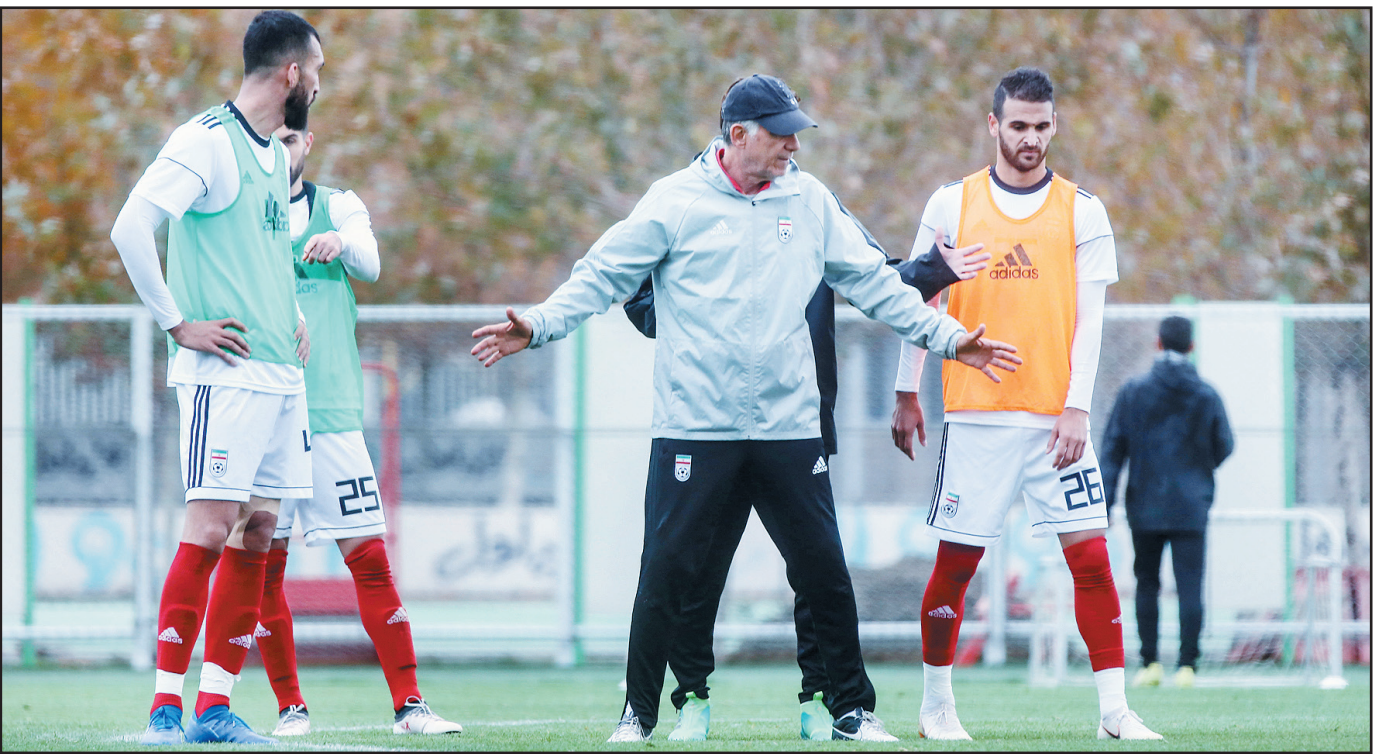
فصل فوتبال ایران