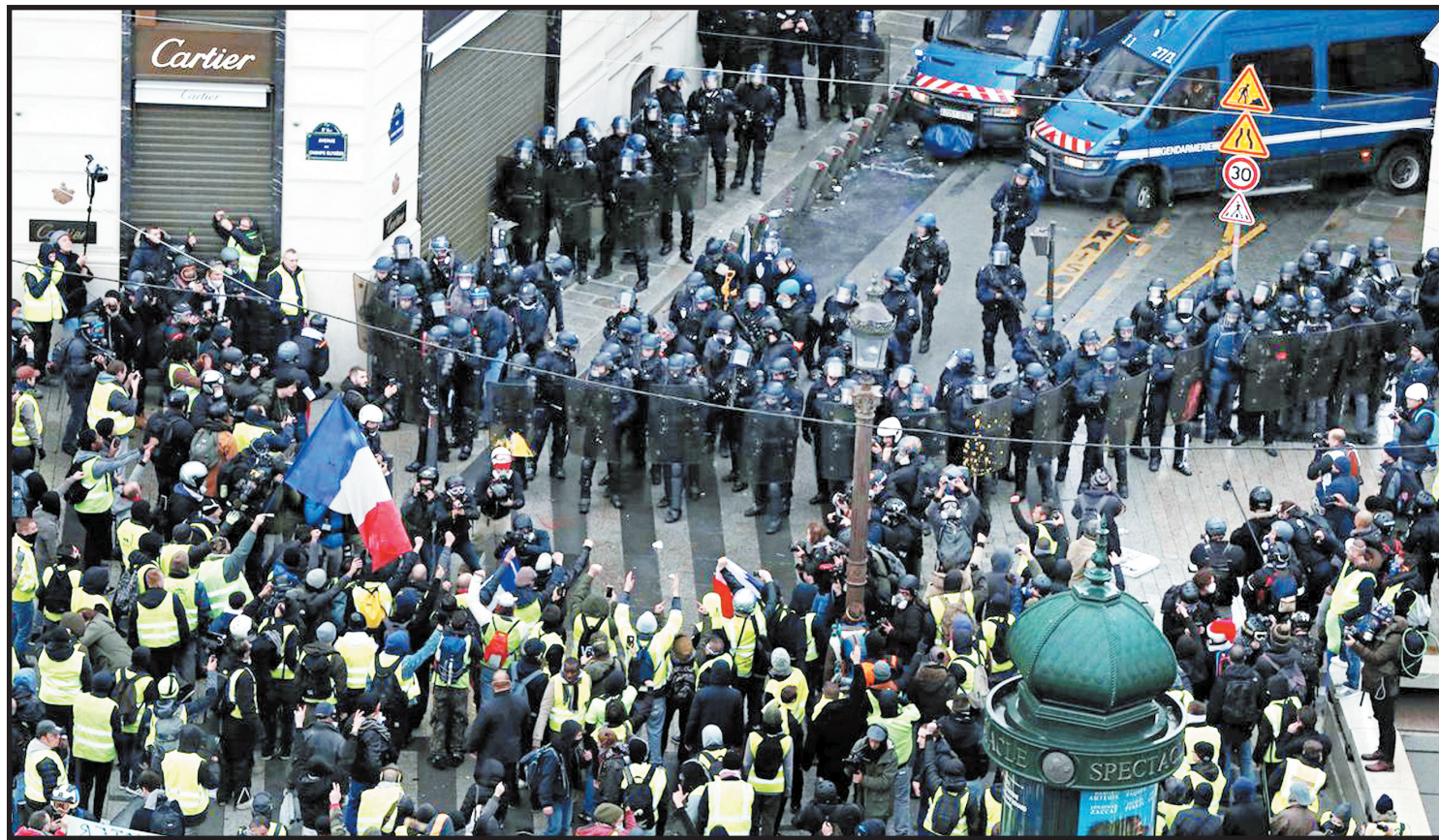
بن بست جمهوری پنجم!