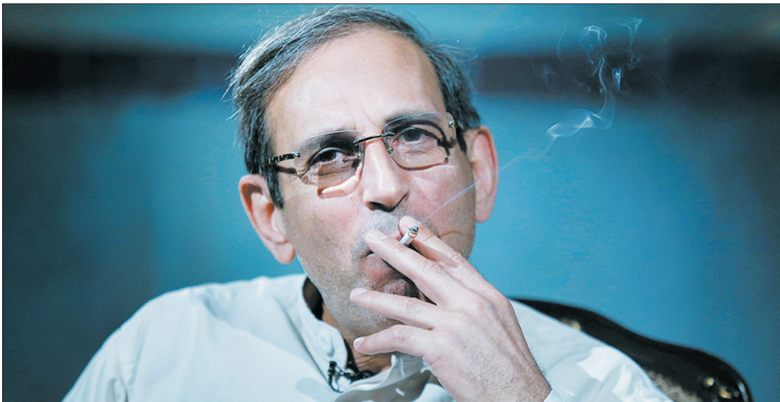
علی شهبان‌پزیران - صفحه ۲

وحید مظلومین معروف به «سلطان سکه» و محمد اسماعیل قاسمی به جرم افساد فی الارض دیروز به دار آویخته شدند