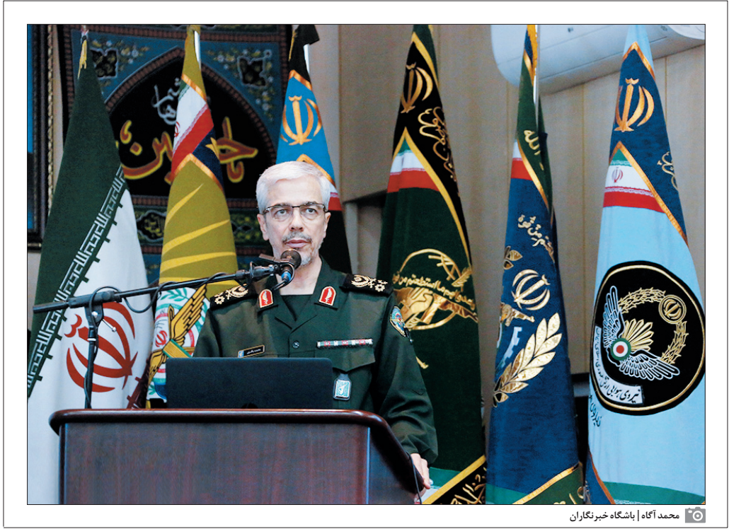
محمد آگاه باشگاه خبرنگاران

رئیس ستاد کل نیروهای مسلح از حضور ایران در جمع‌هفت‌قدرت‌برتر پهبادی دنیاوی‌پیشرفت‌های وسیع ایران در این حوزه خبر داده است. برتری هوایی در سال‌های اخیر تبدیل به یک اصلی در پیروزی در هر نبردی شده‌است. از سال ۱۹۹۱ و جنگ خلیج فارس، امریکا و کشورهای غربی به لطف تکنولوژی برتر خود تبدیل به قدرت مهم هوایی دنیا شده‌اند.باین حال سایر کشورها نیز تماشاجی صرف نبوده‌اند.ایران در طول سال‌های اخیر تبدیل به قدرتی مهم در حوزه پهبادی و موشکی شده‌است.با اتکا به همین قدرت در حوزه پهبادی است که نیروهای مسلح ایران در منطقه خاورمیانه در حال ایفای مأموریت با هواپیماهای بدون سرنشین بوده‌اند.