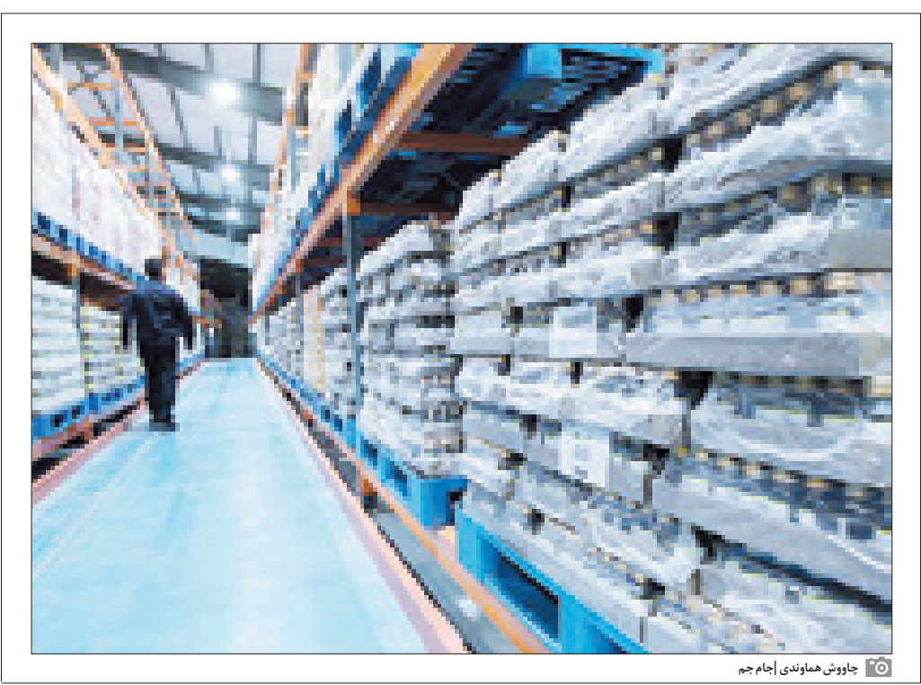
جابوش هاونوی انجام جم

ایران یک صنعت دارویی به خوبی توسعه یافته دارد که تا حد زیادی خودکفاست