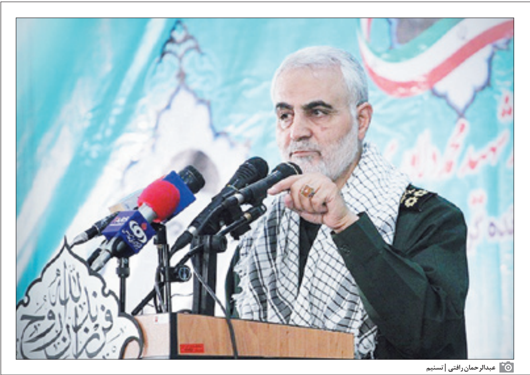
عبدالرحمان راشی آنتینیم

سلیمانی چه نقش مهمی در تحولات خاورمیانه دارد، یعنی پترائوس همان معمار افزایش نیروهای آمریکا در عراق، یک دهه بعد از رسیدن سلیمانی