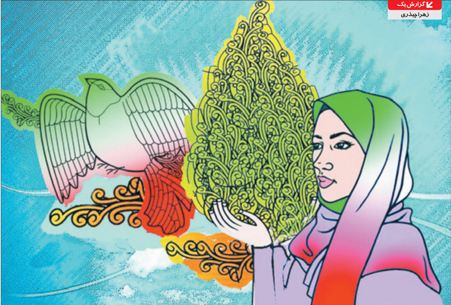
طرح حسین کشتادارایران