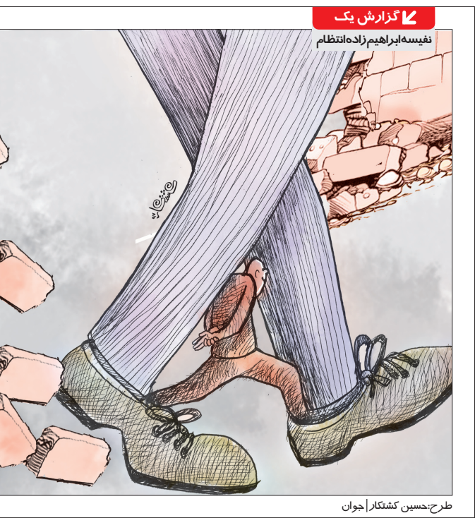
طرح‌حسین کشکدار| جوان

سوم) گرایشات سیاسی که در تمام ارکان جامعه ما مرسوم کرده است. مثلاً در دوره‌هایی که سه قوه و یکرکز سیاسی یکسانی نداشته باشند، قطعاً کشور در تدوین، ابلاغ، اجرا و پیگیری قانون دچار چالش می‌شود. تعارضات جناحی، خودسانسوری دستگاه‌های ناظر برای متهم نشدن به