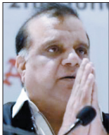
اوکناش مهرپین فاکس اسپورت

۲۳ ساله‌های ژاپن و دستکاری در جام جهانی ۲۰۱۸ را در کارنامه دارد، حالا به فتح جام می‌اندیشند و ثابت کرده که گزیننه مورد اعتدای برای آبی پوشان است. بعداز جام جهانی ترکیب تیم ملی ژاپن تغییر پیدا کرد و نسل جدیدی به زمین آمد. با این حال سرمربی ۵۰ ساله بدون آنکه زمان و راز دست بدهد، سعی کرد از تمام داشته‌هایش استفاده کند. خیلی‌ها ایران را کاندیدای قهرمانی می‌دانستند؛ البته قبل از رویارویی با ژاپن. بازیکنان ساموایی برای کنترل فشار ایران و مقابله با حملات حریف برنامه داشتند. در نیمه دوم تیم ملی ایران به دستور کی‌روش سرعت را چاشنی کارش قرار داد و در نهایت همین مسئله کار دست‌شان داد. ژاپن از اولین موقعیتی که به دست آورد، آن‌هم در شرایطی که مدافعان ایران به سمت داور هجوم برده بودند، استفاده کرد و گل اول را زد. ضربه پنالتی هم مثل گل اول از سمت راست گرفته شد تا دومین گل هم به ثمر برسد. به نظر می‌رسد موریاسو به شاگردانش گوشزد کرده بود که با مهار سردار آزمون خط حمله ایران خلق سلاح می‌شود. این برنامه نیز به خوبی اجرا شد تا در غیاب طارمی، سردار کاری از دستش برنیزاید. در کل مدافعان ژاپن به خوبی مسئولیت‌شان را انجام دادند. ضمن اینکه خط حمله ساموایی‌ها نیز تیم ایران را وادار به عقب‌نشینی کرد. در آخر باید گفت کسل کننده‌ترین تیم جام‌بهتر از خطرناک‌ترین تیم تورنمنت ظاهر شد و حضور در فینال پادش موریاسو و تیمش است.