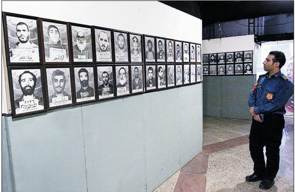
نمایشگاه موزه عبرت ایران و ضد تروریسم در همدان

گروهی از افراد «نژادپرست» با حمله به یک مرکز اسلامی در نیوکاسل، در انگلیس به این مرکز آسیب زده‌اند. رسانه‌های انگلیسی روز یکشنبه از حمله به مدرسه‌ای اسلامی به نام «بجر آکادمی» در منطقه «فتم» در شهر نیوکاسل خبر دادند. به گزارش «بی‌بی‌سی» در این حمله خرابکارانه مهاجمان با شکستن پنجره، صندلی و میزهای این مدرسه و نوشتن شعار بر دیوار، به ساخت