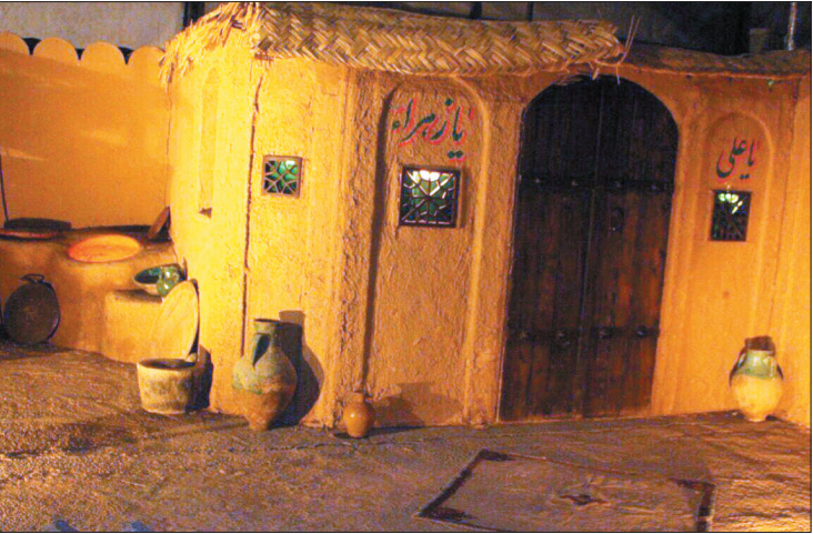
نمایی از کوچه‌های بنی‌هاشم در شهر رفسنجان در اواخر اردیبهشت ۱۳۸۶