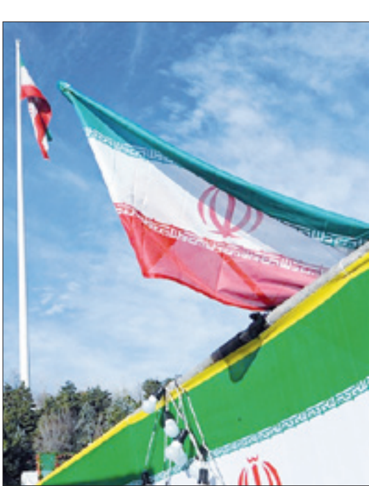
هنوز بزرگ‌ترین برچم کشور همزمان با دهه فجر در اراضی عباس آباد