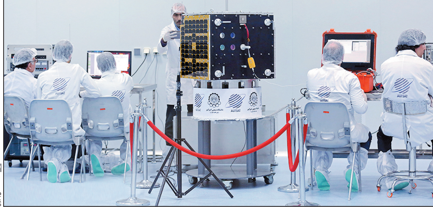
فانسه هاشمی - ایران

ماهواره «دوستی» برای پرتاب کاملاً آماده است. تست‌های فنی ماهواره «پیام» هم تمام شده و در حال بسته‌بندی و انتقال برای پرتاب است. | صفحه ۳