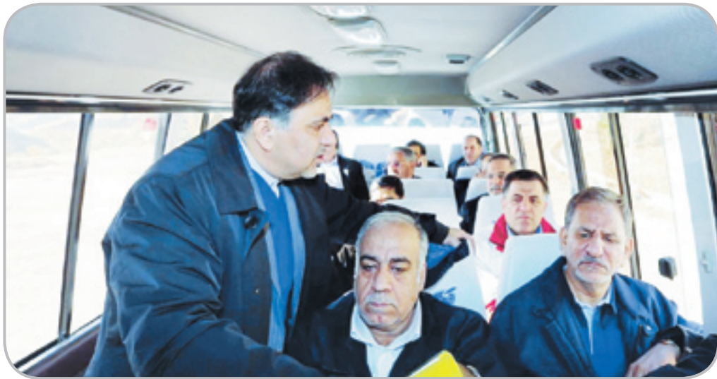
خب بابا تقصیر من چیه؟ چند روز نبودم، هیچکس بهم نگفته بود همه دارید از مسکن مهر انتقاد می‌کنید!

وزیر راه: مسکن مهر کرمانشاه مقاومت مناسبی مقابل زلزله داشت.