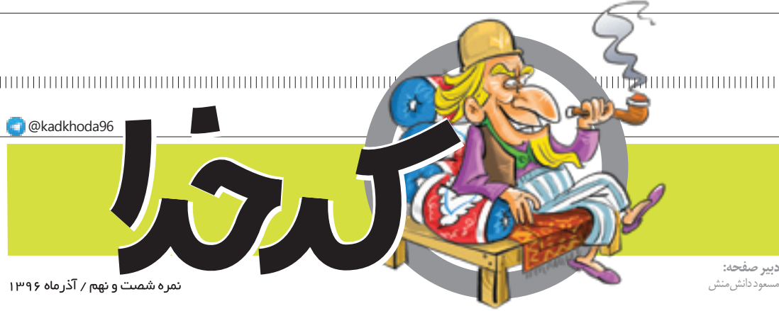
دیبر صفحه: مسعود دانش‌منش