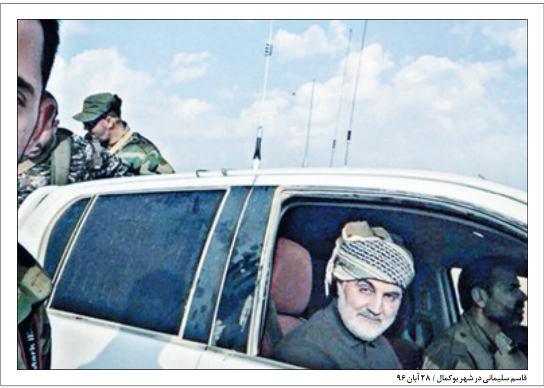
قاسم سلیمانی در شهر بوکمال ۲۸ آبان ۹۶

جغرافیایی را در اختیار ندارد، سوریه ماند و شهر بوکمال در شرق استان دیرالزور، این شهر آخرین دژ داعش در سوریه و آخرین شهری بود که تحت اشغال داعش بود و اهمیت زیادی داشت، بنابراین عملیات گسترده برای آزادسازی آن آغاز شده و این شهر دو ماه تبدیل کنیم و عمر این شجره خبیثه و این غده سرطانی خطرناک ساخته شده به دست امریکا و اسرائیل را به پایان برسانیم و جشن آن را در ایران و در بین همه منطقه اعلام کنیم.»