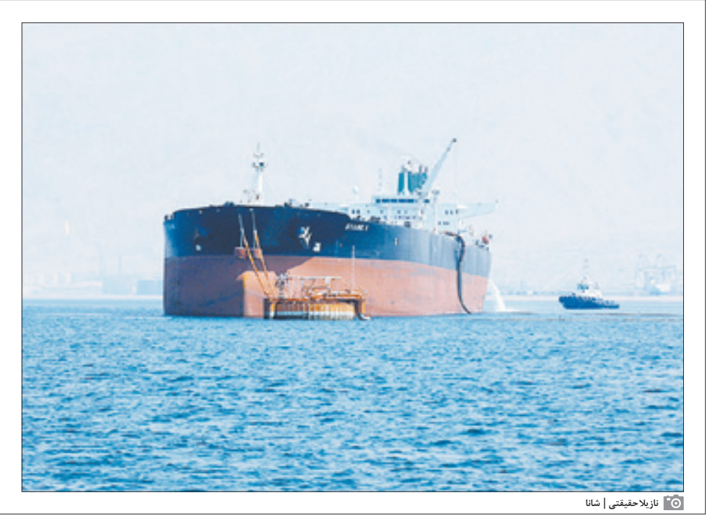
نازیرلا حقیقتی | شانا

روزنامه جوان | شماره ۵۲۴۰ | سرویس اقتصادی ۸۸۴۹۸۴۳۴