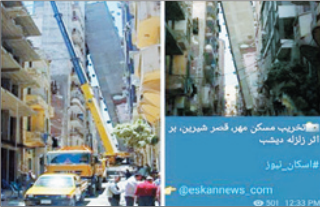
آتش‌خیزب مسکن مهر قصر ضورین، بر اثر زلزله دیشت