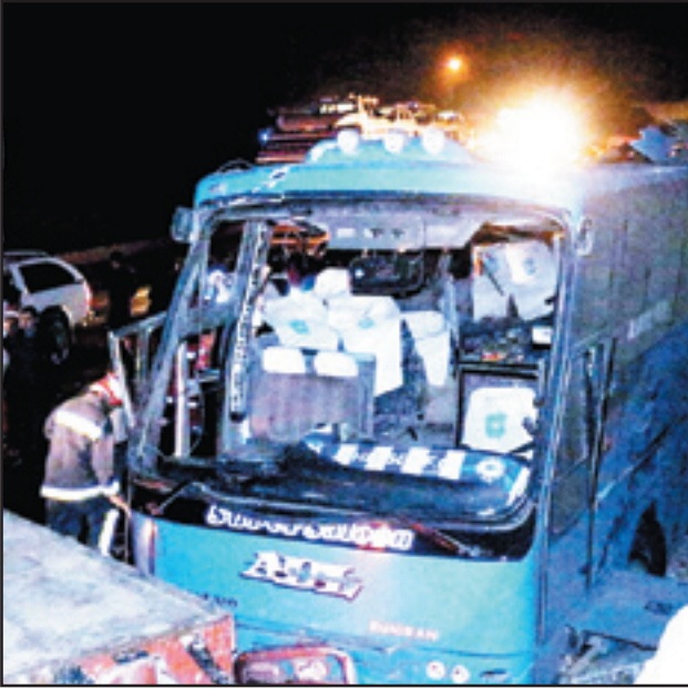
ساعت بوده که این سرعت بیش از سرعت

مجاز در محل حادثه بوده است که این امر نشان می‌دهد به دلیل سرعت زیاد کنترل اتوبوس از دست راننده خارج شده‌است. سردار حمیددی افزود: برابر گزارشات سامانه سپهنت