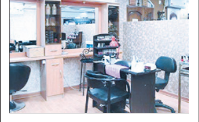
یک مرکز خدمات زیبایی در تهران.

تا پایان شهریور سال جاری تعداد آرایشگاه‌های زنانه دارای مجوز صنفی در تهران ۱۱۳۲۳ آرایشگاه اعلام شده در حالی که آرایشگاه‌های غیر مجاز ۱۵۴۲۲ مورد است! وضعیت تخلفات در این واحدهای صنفی به گونه‌ای اضطرابی است که دادستان تهران وضعیت آرایشگاه‌های شهر تهران را به عنوان یکی از مصادیق آسیب‌های اجتماعی مورد توجه قرار داده و مستند به گزارش اخیر پلیس در این راستا گفته است: به پلیس