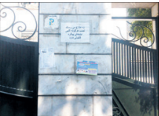
نمای شهر زیر تبلیغات شهری