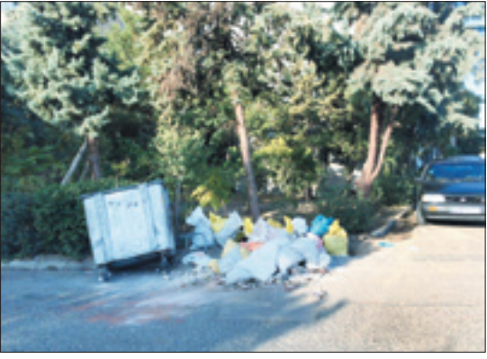
ریختن نخاله‌های ساختمانی در کنار فضای سبز (نحیه ۲ منطقه ۲)