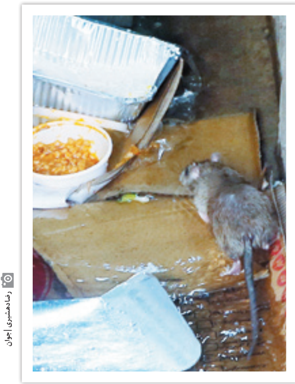
رشد جمعیت موش‌ها

اگر به این ساختمان‌ها، مدارس را نیز بیفزاییم، متوجه عمق فاجعه می‌شویم؛ فاجعه‌ای که مسئولان هر چه سریع‌تر باید نسبت به آن اقدام کنند.