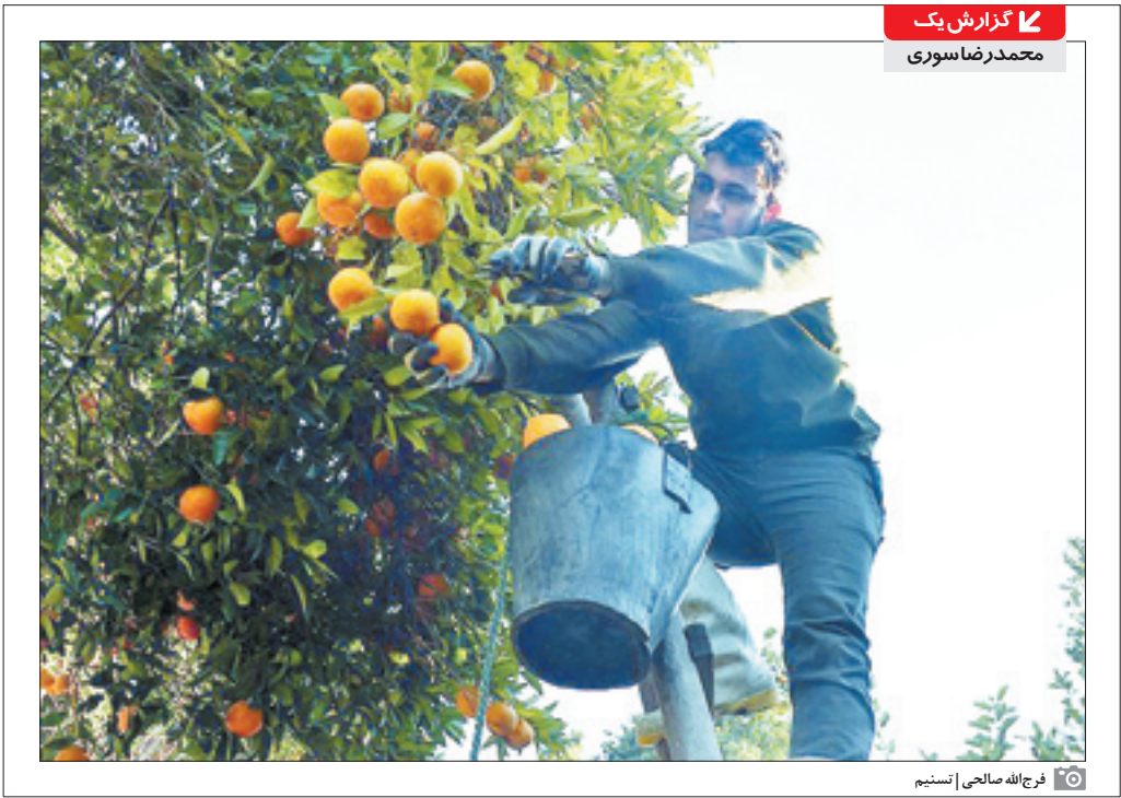
فرخ‌الله صالحی | انسینم