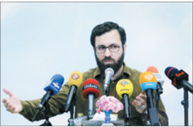
تکمیل تصویر مخاطب‌های جوان

افتخار ما این است که از هیچ سفار تخانه خارجی پول نمی‌گیریم