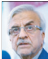
مصطفی‌هاشمی‌طبا رئیس سابق سازمان تربیت بدنی

در دو بازی تیم را همراهی نکنند. بازیکنان می توانند برای جلوگیری از بروز این اتفاقات آپشن هایی را در قراردادشان بگنجانند.فوتبالست‌های کشورمان به خاطر اینکه از سوی باشگاه تحت فشار بودند و احتمال جرمه شدن وجود داشت، مقابل حریف رژیم جعلی به میدان رفتند. اما این تنها یک بخش ماجراست؛ چراکه بحث عدم روبروایی با ورزشکاران رژیم‌صهیونیستی دولتی نیست و همواره از سوی ورزشکاران خودمان صورت گرفته‌است.غیبت این دو بازیکن در بازی برگشت حتی می توانست محرومیت‌ها و جرمه‌هایی از سوی یوفا هم به دنبال داشته باشد. هر چند که بازمه می توانستند بی جرمه را به نتشان بمانند و بازی نکنند. بااین حال نباید دست به اقداماتی احساسی بزنیم. در آن سوی مرزهایسپاری منتظرند تاخیر محرومیت بازیکنان ایرانی تیم پانتیونیوس را بشنوندو علیه فوتبال مان موضع بگیرند.بنابر این فدراسیون فوتبال باید هوشمندانه با این موضوع برخورد کند؛ چراکه است ممکن است بحث دخالت دولت مطرح شده و فدراسیون فوتبال محروم شود. مهم این است که افکار عمومی و مردم این حرکت را تائیدح کرده و علیه آن موضع گرفته‌اند. باید قبل از وقوع اتفاق این نوشته می شود.چنین اتفاقی رخ می دهد. مردم این موضوع را تائید کردند و فدراسیون هم حتماً این بازیکنان را توبیخ خواهد کرد. ما باید با پوشش های دستورالعمل هایی که وجود دارد این موضوع را خنثی می کردیم.البته آنها بهانه داشتند و می گفتند ما تبعیض نژادی داریم در حالی که دو انسان در حال ورزش هستند، اما فکر می کنم این دو فوتبالستی می توانستند بدون اینکه اسم خاصی از تبعی بیابند در قراردادشان این اختیار را پیش بینی کنند که در چند مسابقه شرکت نکنند.