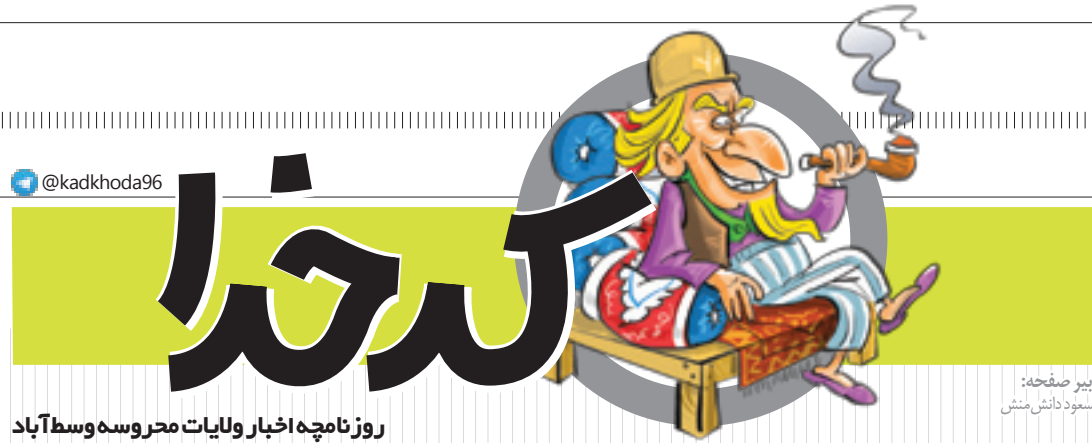
دبیر صفحه: مسعود دانش‌منش

پس همان موقع هم منظورشان این بود که ما موشک ساختیم و سایه جنگ را دور کردیم! منتها در لفافه می‌گفتند. خدایا ما را ببخش، خیال کردیم منظورشان این بوده که با مذاکره سایه جنگ را برداشته‌اند!