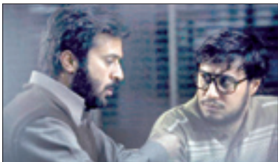
نظر رهبر معظم انقلاب اسلامی درباره فیلم مهدویان

روزنامه سیاسی، اجتماعی و فرهنگی صبح ایران یک‌شنبه ۲۵ تیر ۱۳۹۶ - ۲۱ شوال ۱۴۳۸ سال نوزدهم - شماره ۵۱۳۸ - ۱۶ صفحه قیمت در استان تهران و البرز: ۵۰۰تومان سایر استان‌ها: ۳۰۰ تومان