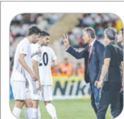
این چندتاست؟! می‌خوام ببینم می‌تونید دروازه را خوب ببینید؟

حالا تا دیروز همین موشک‌ها داشته برجامو نقض می‌کرده‌ها! داداش، انقلابی کی بودی تو؟!!