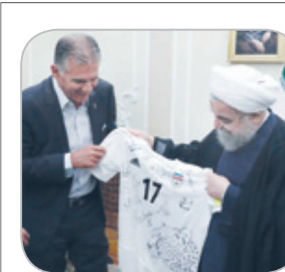
این چرا اینقدر خط‌خطیه؟ به تمیز ترش را بید!