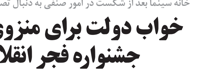
روزنامه جوان | شماره ۵۱۲۸ | سه‌شنبه ۱۳ تیر ۱۳۹۶ | ۹ شوال ۱۴۲۸ | اذان ظهر: ۱۳:۰۹ | غروب آفتاب: ۲۰:۰۴ | اذان مغرب: ۲۰:۵۵ | نیمه‌شب شرعی: ۰۱:۰۶ | اذان صبح فردا: ۰۴:۰۵ | طلوع آفتاب فردا: ۰۵:۵۴